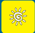
Protezione dal sole