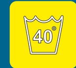
Lavabile in lavatrice