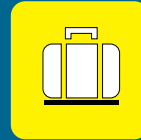
Facilità di trasporto