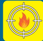
Possibilità materiale ignifugo