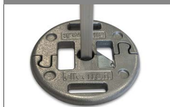
Peso zavorra per gazebo PRO e LIGHT.