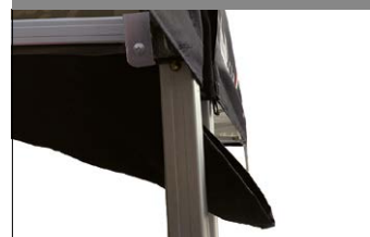
Grondaia per gazebo disposti in serie