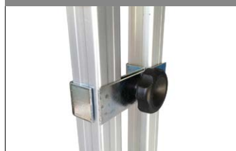
Morsetti accoppiatori per telai gazebo PRO 40mm.