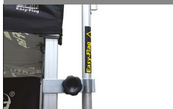
Fissaggio delle bandiere Easy-Flag al telaio gazebo PRO 40mm.