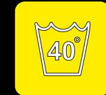
Lavabile in lavatrice