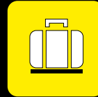
Facilità di trasporto