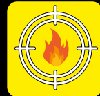
Possibilità materiale ignifugo