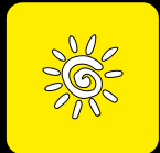
Protezione dal sole