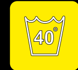
Lavabile in lavatrice